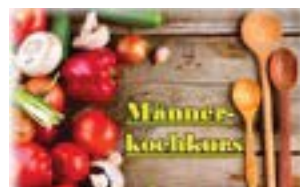
Irmgard Inninger Hauswirtschafts- meisterin

18780 Termine: Do 19.03. / 23.04. / 14.05.2020 jeweils 10.00 - 11.30 Uhr Ort: Bildungszentrum St. Nikolaus, Rosenheim Gebühr pro Treffen: 6,00 € • Gebühr gesamte Reihe: 18,00 € Gruppengröße bis 20 Pers. • Anmeldung • Kooperation: Stadtbibliothek Rosenheim